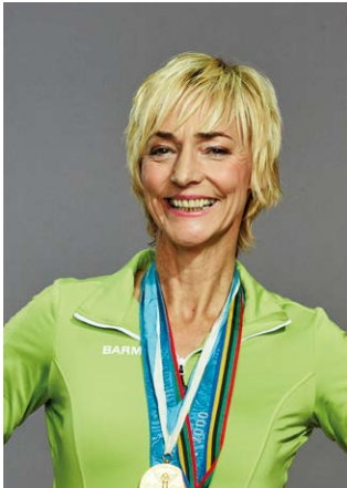
Heike Drechsler (Olympiasiegerin im Weitsprung):